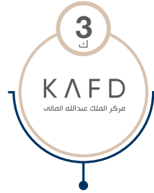
مركز الملك عبدالله المالي