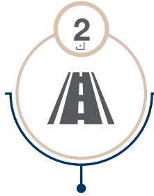
طريق الدائري الشمالي