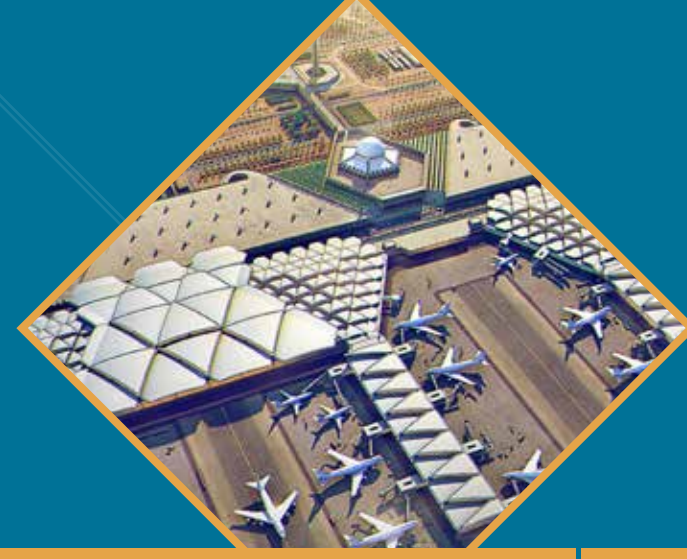
مطار الملك خالد