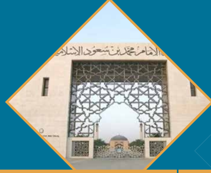
جامعة الإمام محمد بن سعود