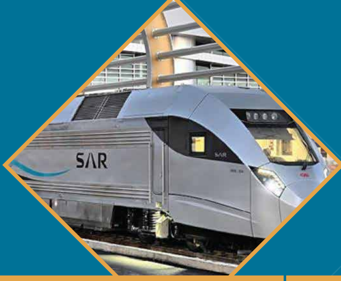
محطة القطار سار