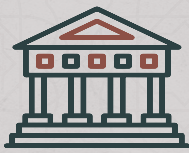
مناطق تاريخية تراثية